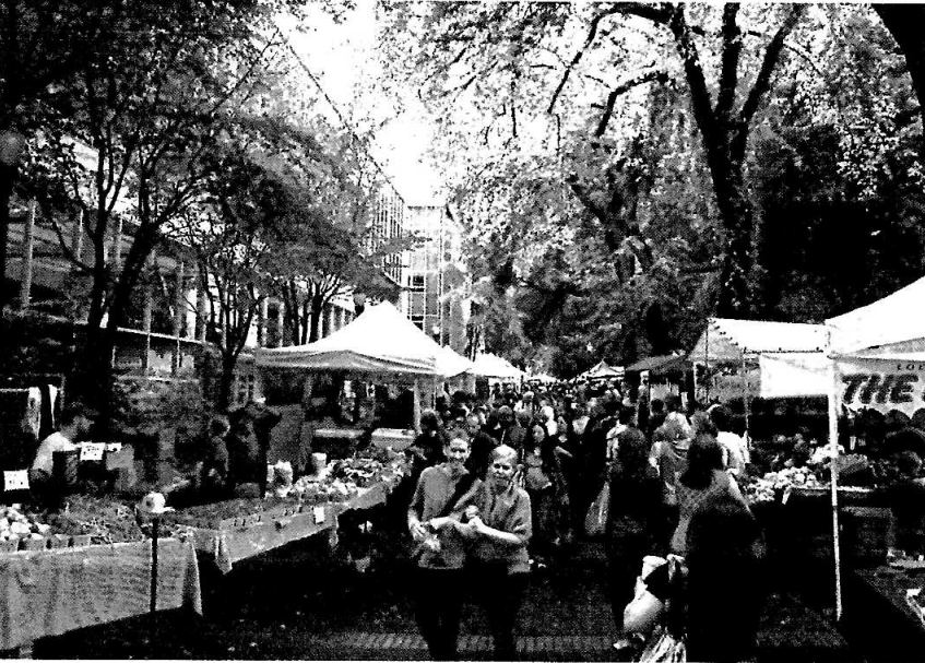
定住、交流人口と地域経済循環増に繋がるファーマーズマーケット