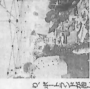
環境保全と経済発展がリンク

環境と経済の両立が実現される。サステイナブルな暮らしや働き方を作ることで、環境と経済の両立が実現される。 環境と経済の両立が実現される。サステイナブルな暮らしや働き方を作ることで、環境と経済の両立が実現される。