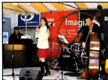
▲ ダイヤ街商店会メンバー