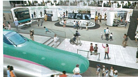
⑥運転士や車掌など、鉄道を支える仕事を体験できる「仕事」ゾーン ⑦未来の駅や鉄道にアバターで入り込めるミュージアム「未来」